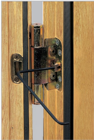
Haustürbänder für Holzhaustüren Imbusschlüssel 4 mm

Eine Gewährleistung bleibt nur bestehen, wenn die Montage durch einen Montage-Fachbetrieb nach unseren Montagerichtlinien erfolgte. Technische Änderungen bei der Montage behalten wir uns vor.