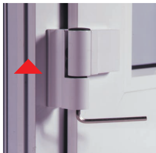
Höheneinstellung ohne An- und Ausheben der Tür. (Stufenlos + 4 mm)